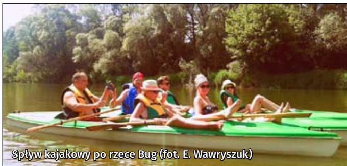
Spływ kajakowy po rzece Bug

Spływy kajakowe po rzekach Poleskiej Doliny Bugu stanowią coraz bardziej popularną formę rekreacji. Jest to propozycja dla osób lubiących wypoczywać aktywnie, jak i dla spragnionych mocniejszych wrażeń. Na obszarze Poleskiej Doliny Bugu występują rzeki ze szlakami o różnej skali trudności zarówno dla nowicjuszy, jak i dla zaawansowanych. Spływy kajakowe to także atrakcyjna forma spędzania wolnego czasu dla miłośników przyrody, gdyż widoki z perspektywy kajaka robią niesamowite wrażenie.