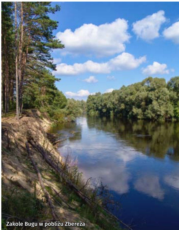
Zakale Bugu w pobliżu Zberezha

Kolejną rzeką, po której odbywają się sptywy kajakowe jest Włodawka – lewobrzeżny dopływ Bugu. Szlak ma 24 km długości. Jest to szlak łatwy i nieuciążliwy, a widoki są niezwykle malownicze. Szlak rozpoczyna się w Kołaczach, tam znajduje się miejsce do wodowania oraz zadaszenie turystyczne. Kolejne miejsce postojowe mieści się w Suchawie, przy przepięknej dawnej cerkwi prawosławnej Kazańskiej Ikony Matki Bożej, która obecnie pełni funkcję kaplicy katolickiej. Następne miejsce wodowania mieści się w Adamkach wśród urokliwej scenerii polany, lasów i rzeki. Jest tam dobrze rozbudowana infrastruktura turystyczna: obszerne zadaszenie, miejsce do rozpalenia ogniska, pole namiotowe. Dalej szlak kajakowy prowadzi w kierunku Włodawy, umożliwiając podziwianie panoramy miasta. Punkt wodowania znajduje się w mieście przy zabytkowym barokowym kościele pw. św. Ludwika i klasztorze, który nie sposób nie zwiedzić będąc w tej okolicy. Mimo, że szlak kończy się w tym miejscu,