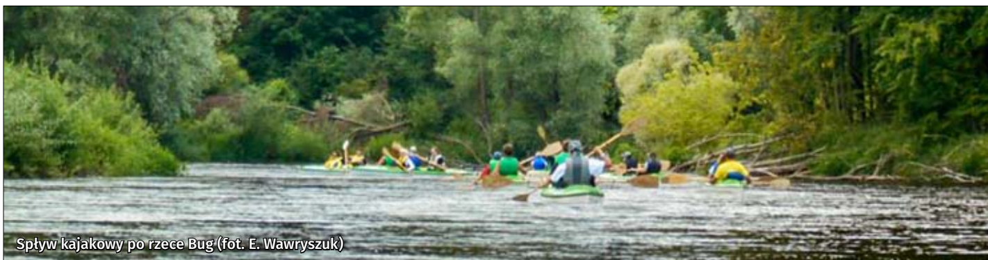
Spływ kajakowy po rzece Bug

Największą z rzek na obszarze jest graniczna rzeka Bug , po której wytyczono szlak „Poleska Dolina Bugu” o długości 62 km. Szlak rozpoczyna się w Siedliszczu, przy dopływie Bugu – Uherce, a kończy w Różance. Mimo, że szlak jest dość łatwy, należy zachować ostrożność, ponieważ meandrujący Bug cechuje się dużym wahaniami poziomu wody i należy pamiętać, że na tym obszarze Bug jest naturalną granicą pomiędzy Polską a Ukrainą i Białorusią, w związku z tym, należy trzymać się lewej strony rzeki. Zamiar spływu po rzece granicznej należy zgłosić odpowiednio wcześniej do odpowiedniej jednostki straży granicznej, dlatego najwygodniej i bezpieczniej zlecić organizację spływu firmie, która